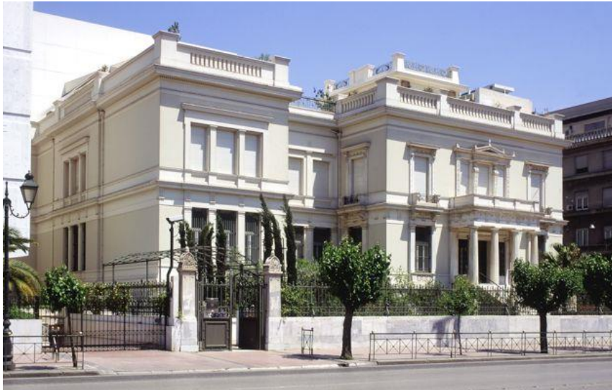
Μουσείο Μπενάκη Ελληνικού Πολιτισμού

Το Σωματείο «Οι Φίλοι του Μουσείου Μπενάκη» είναι άρρητα συνδεδεμένο με το Μουσείο, που ο μεγάλος ευεργέτης Αντώνης Εμμ. Μπενάκης προσέφερε στο Ελληνικό Έθνος.