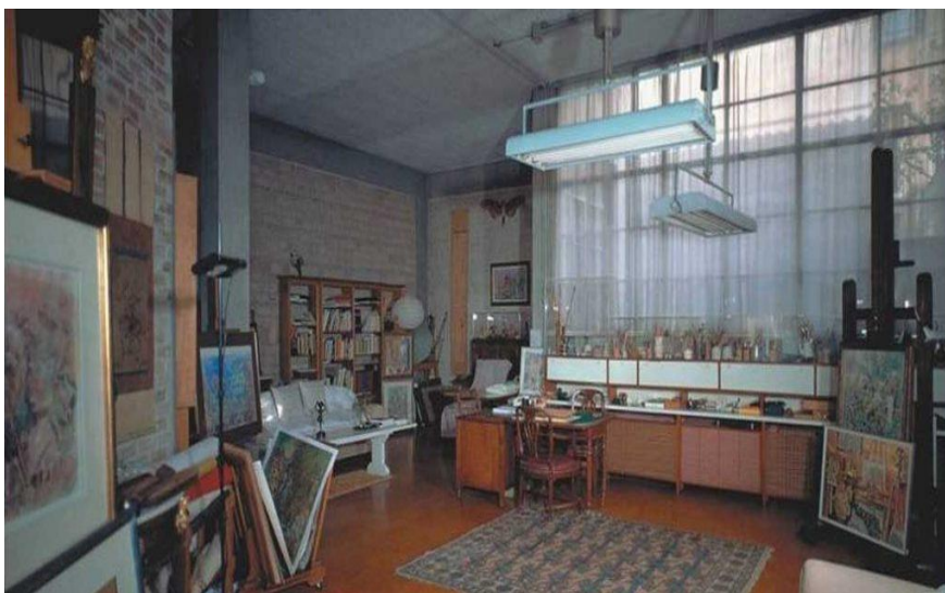
Πινακοθήκη Ν. Χατζηκυριάκου-Γκίκα – το ατελιέ του ζωγράφου, όπου το Γραφείο των Φίλων

Στις 21 Δεκεμβρίου 2018 το Σωματείο «Οι Φίλοι του Μουσείου Μπενάκη» τιμήθηκε με βραβείο «οίκοθεν» από την Ακαδημία Αθηνών, αφού είχε συμπληρώσει 61 χρόνια συνεχούς παρουσίας στο χώρο του ελληνικού πολιτισμού.