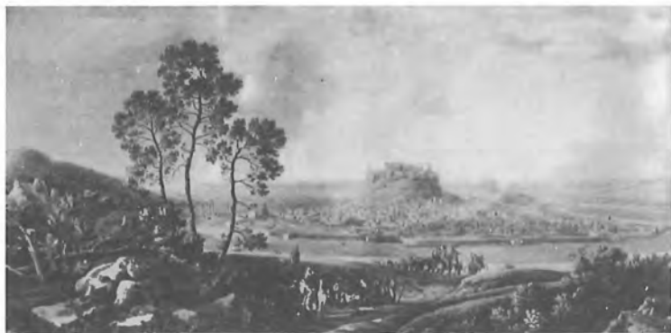
L. F. Casses, Γενική άποψη της Άθήνας στά τέλη του 18ου αιώνα. Έγχρωμη χαλκογραφία.