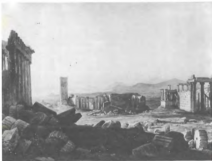
Th. Horner, 'Η Άκρόπολη μετά τήν Έπανάσταση. Ύδατογραφία.