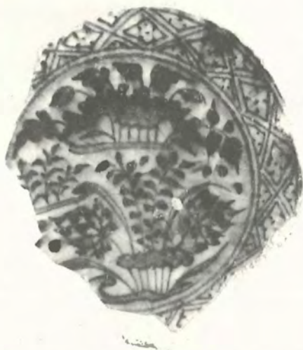
Κεραμικό με θέμα λώτου, μέσα 14ου αί.