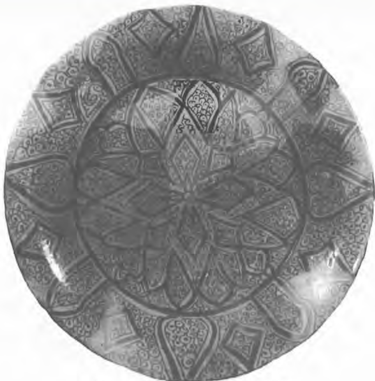
Κεραμικό μέ θέμα άνοιχτοϋ λουλουδιοϋ.

τίς Συρο-Αιγυπτιακές άγορές, μέ δεδομένες τίς ύποτυπώδεις σχέσεις ανάμεσα στό Λατινικά πριγκηπάτα καί τούς Μамελοϋκουσ.