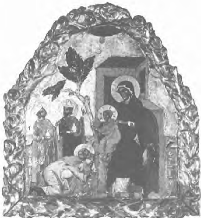
Εικόνα με τήν προσκύνηση τῶν Μάγων

τά φωτοστέφανα μέ τό στικτό διάκοσμο. Ὅσο γιά τόν πλοχμό στό πλαίσιο τῆς εἰκόνας, χρησιμοποιεῖται σέ διάφορες παραλλαγές, στό ἀρμοκάλυπτρο βημοθύρων τοῦ τέλους τοῦ 15ου αἰώνα, ὅπως στό γνωστό βημόθυρο τῆς Πάτμου, πού ἀποδίδεται στόν Ἄνδρέα Ρίζο. Πρόκειται λοιπόν γιά μιάν εἰκόνα ἔντονα ἐπηρεασμένη ἀπό κάπως παλιότερα Ἰταλικά πρότυπα, πού μπορεῖ νά χρονολογηθεῖ γύρω στά τέλη τοῦ 15ου αἰώνα.