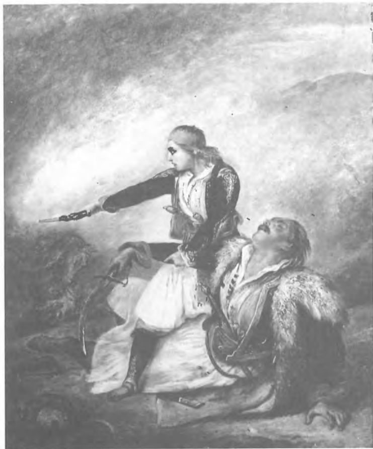
HENRI SCHEFFER « Νεαρός υπερασπίζεται πληγωμένο πολεμιστή »