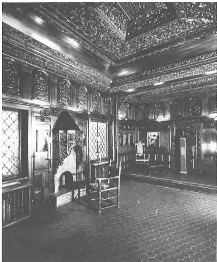
Κοζανίτικος όντάς, Δωρεά Έλ. Σταθάτου