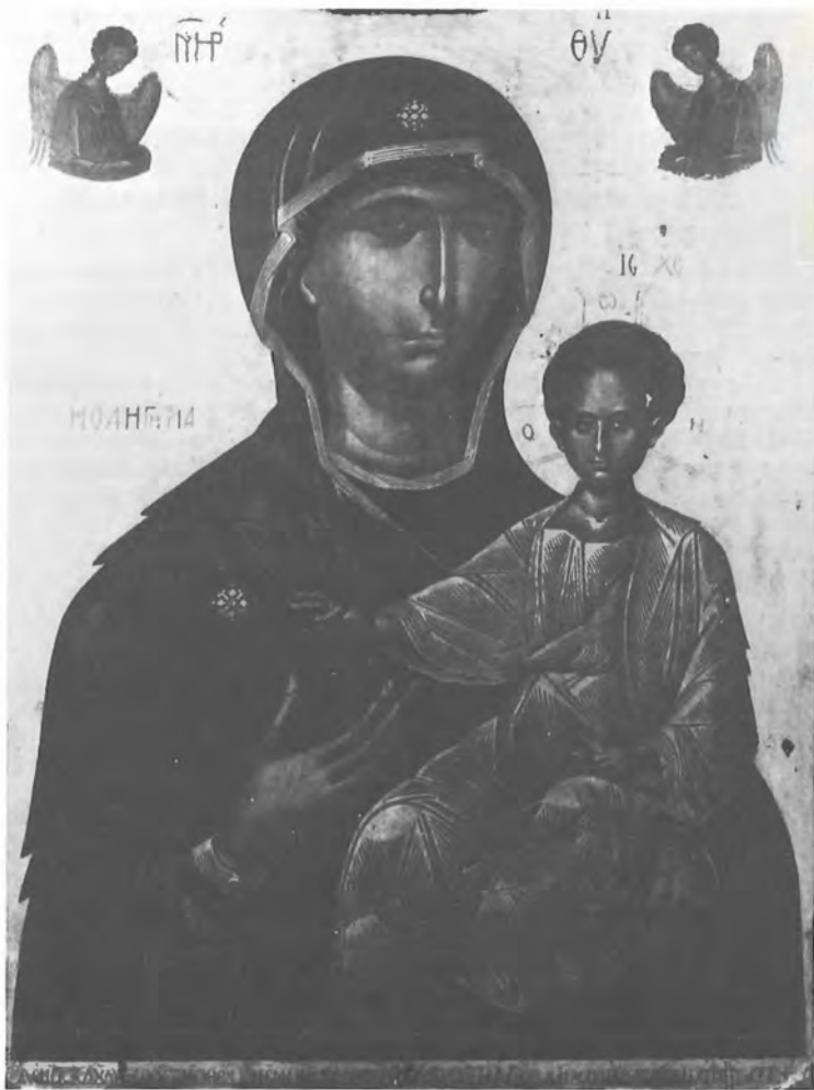
1. Θεοτόκος Βρεφοκρατούσα «Ὁδηγήτρια» Νο 3018 Πρὶν τῆ Συντήρηση.