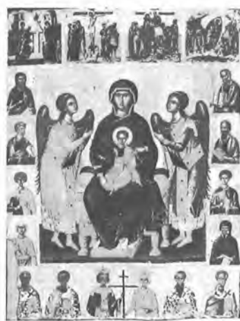
9. Παναγία Ἐνθρονη μέ Ἄγγελους. Νο 3051 Μετά τή Συντήρηση.