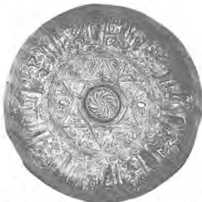
21. Ἀσημένιο τάσι. 19ος αἱ. Νο 27987. Ἐσωτερική ὄψη.

Κατερίνας Κορρέ, Ἡ ἀνθρώπινη κεφαλή στή Νεοελληνική Λαϊκή Τέχνη, 1978· Τῆς ἴδιας, Οἱ παλάσκες τοῦ Ἐθνικοῦ Ἱστορικοῦ Μουσείου, Δελτίον Ἱστορικής καί Ἐθνολογικής Ἑταιρείας τῆς Ἑλλάδος, 27, 1984, σσ. 197 - 284.