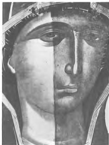
3. Θεοτόκος Βρεφοκρατούσα «Ὁδηγήτρια» Νο 3018 Στάδιο καθαρισμοῦ τῆς ζωγραφικῆς.