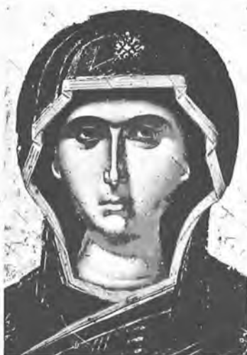
7. Παναγία Ἐνθρονη μέ Ἄγγελους. Νο 3051 Μετά τήν αἰσθητική ἀποκατάσταση (RETOUCHE).