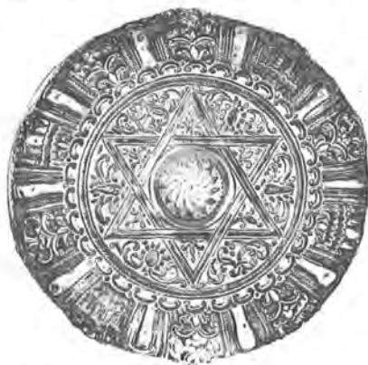
22. Ἀσημένιο τάσι. Νο 27987. Ἐξωτερική ὄψη.