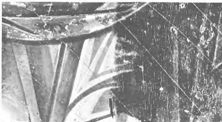
13. Παναγία ἐνθρονη μετ' Ἀγγέλους Νο 3051. Λεπτομέρεια ἀφαίρεσης τοῦ βερνικιοῦ.