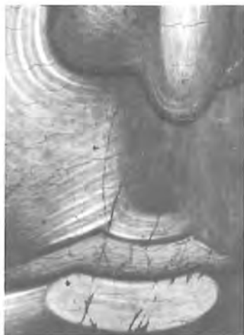
4. Θεοτόκος Βρεφοκρατούσα «Ὁδηγήτρια» Νο 3018 Ὑπέριυθη φωτογράφιση.