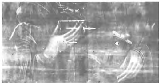
5. Νο 3018 Ἀκτινογραφία με σκοπό τόν έντοπισμό καί τήν έκταση τῶν φθορῶν. Διακρίνεται τό ἐγχάρακτο σχέδιο στήν εικόνα.