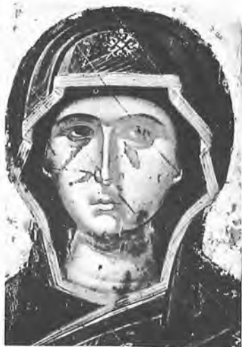
6. Παναγία Ἐνθρονη μέ Ἄγγελους. Νο 3051 Λεπτομέρεια ἀπό τό κεφάλι τῆς Παναγίας πρίν τή Συντήρηση.