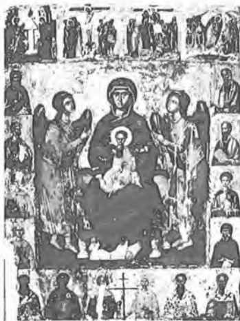
8. Παναγία Ἐνθρονη μέ Ἄγγελους. Νο 3051 Πρίν τή Συντήρηση.