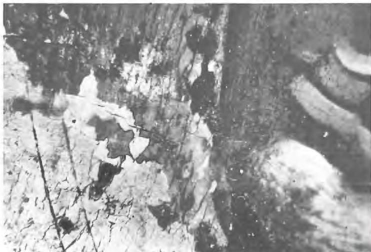
11. Παναγία ἔνθρονη μετ' Ἀγγέλους, Νο 3051 Λεπτομέρεια. Μακροφωτογράφηση. Διὰκρίνονται ἐπιζωγραφίσεις στὸ χρυσοῦ φόντο.