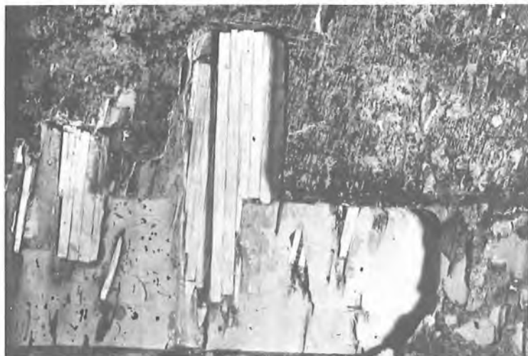
10. Παναγία ἔνθρονη μετ' Ἀγγέλους, Νο 3051 Λεπτομέρεια. Ξυλουργικές ἐργασίες ἀπὸ τὴν πίσω πλευρὰ τῆς εἰκόνας.