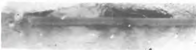
14. Θεοτόκος Βρεφοκρατούσα «Ὁδηγήτρια» Νο 3018. Μικροφωτογράφιση. Ἐγκάρσια τομή τῆς ζωγραφικῆς ἀπὸ τοῦ «ἱμάτιο» τοῦ Χριστοῦ. Διακρίνονται: α) προετοιμασία β) προπλασμός γ) ἀρχικό βερνίκι δ) μεταγενέστερο βερνίκι.