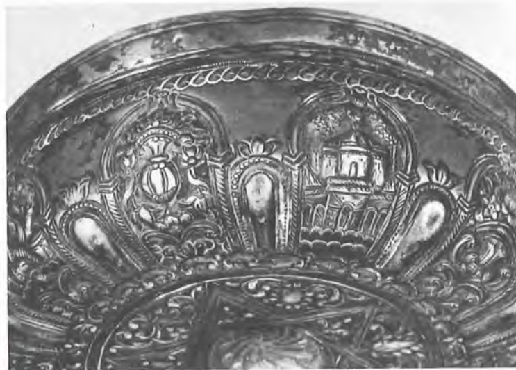
24. Άσημένιο τάσι. Νο 27987. Λεπτομέρεια.