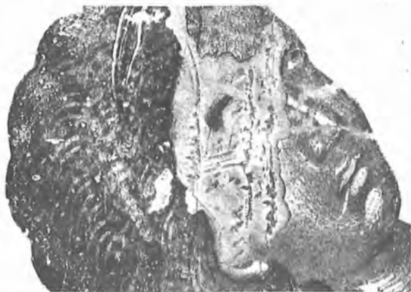
12. Θεοτόκος Βρεφοκρατούσα «Ὁδηγήτρια» Νο 3018. Μακροφωτογράφιση. Διακρίνονται οἱ φθορές τῆς ζωγραφικῆς ἀπὸ τῆς μετακινήσεως τοῦ ἔργου.