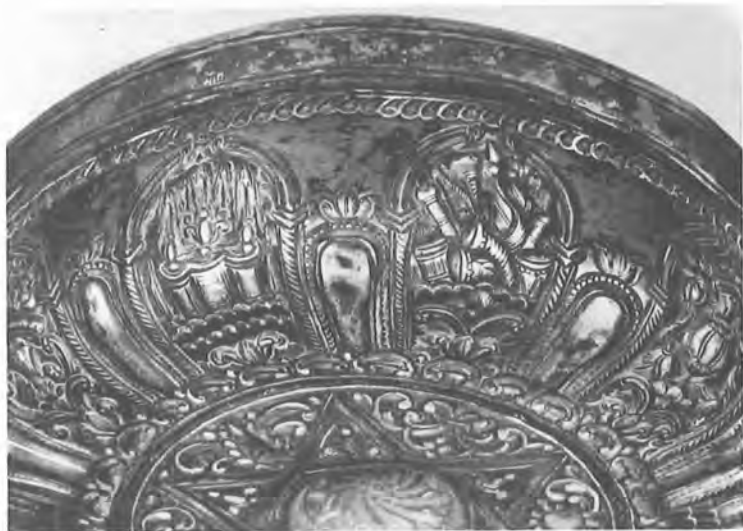
23. Άσημένιο τάσι. Νο 27987. Λεπτομέρεια.