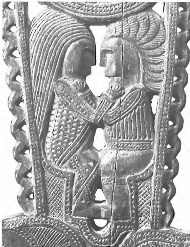
Εἰκ. 3. Ρόκα Συλλογῆς Εὐκλείδη (λεπτομέρεια)

Τό πλάτωμα λυρσοειδές· τά πλαϊνά τῆς λύρας σχηματίζουν, μέ περίτεχνο τρόπο δουλεμένα, σώματα δικέφαλων «μειλίχιων» δρακόντων (Εἰκ. 2). Τά στόματά τους, ἀνοικτά, μέ στελέχη πού ξεπηδοῦν ἀπό μέσα τους. Ἡ ἐπιφάνεια τῶν σωμάτων τους καλύπτεται μέ φολιδωτό κόσμημα. Τά μάτια τους ἀποδίδονται μεγάλα, ἀμυδαλόσχημα, μέ στιγμή στό κέντρο καί λεπτές «βλεφαρίδες» ὀλόγυρα. Οἱ πρός τά ἔξω παρυφές τοῦ λυρσοειδοῦς τμήματος μέ σχοινοειδές πλέγμα.