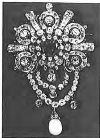
Κόσμημα με σμαράγδι, διαμάντια, μπριγιάν και μαργαριτάρι. Δωρεά του Λάμπρου Εύταξια.