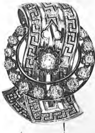
Κόσμημα με μπριγιάν και λεπτό έγχάρακτο μαιανδρικό διάκοσμο σε χρυσό. Δωρεά του Λάμπρου Εύταξια.