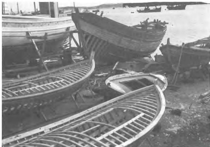
Καρνάγιο στίς Κυκλάδες