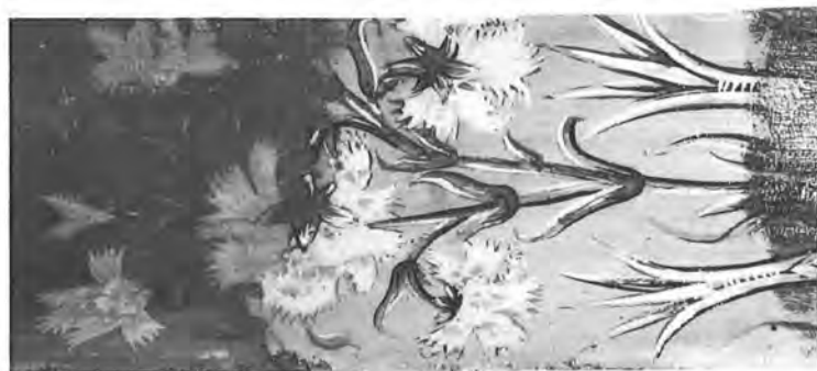
Δείγματα καθαρισμού (άποβερνικώσεις)