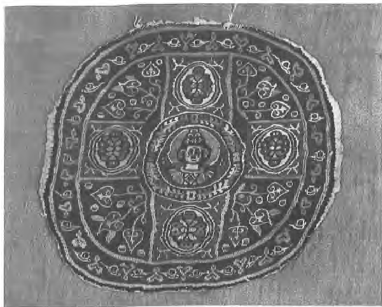
2 Ύφαντό πολύχρωμο τῆς Σάμου, τέλη 19ου αἰῶνος. Ἀρχεῖο Ἄννας Ἀποστολάκι.

Τό μικρό αὐτό σημεῖωμα δέν θά πρέπει νά θεωρηθεῖ σάν μιά ὀλοκληρωμένη παρουσίαση ἑνός τόσο σημαντικοῦ ἀρχείου, πού θά ἀποτελέσει τό ἀντικείμενο μιᾶς μελλοντικῆς ἐργασίας, ἀλλά μιά ἀπλή ἀναφορά σέ ἕνα ἀπό τά τόσο σημαντικά ἀποκτήματα πού συνθέτουν τό μουσειακό θησαυρό τοῦ Μουσείου Μπενάκη.