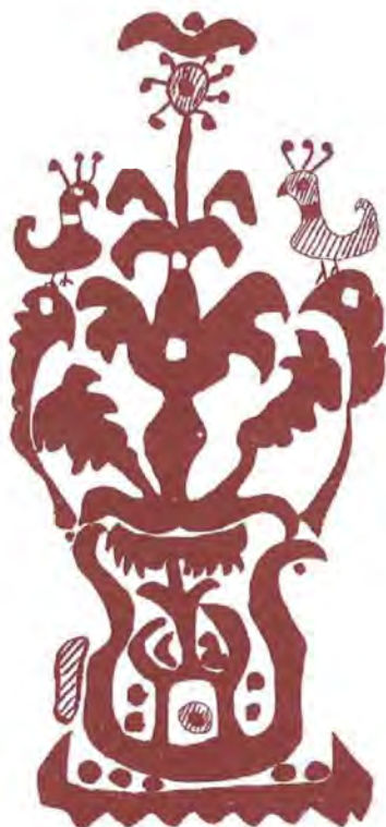
Σχέδιο Λίλα ντέ Τσαβές Κέντημα Ήπειρου 18ου Αιώνα