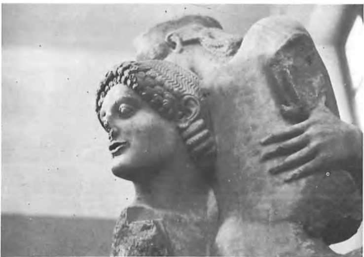
Ὁ Θησέας καί ἡ Ἀντιόπη ἀπό τό ναό τοῦ Ἀπόλλωνα στήν Ἐρέτρια.