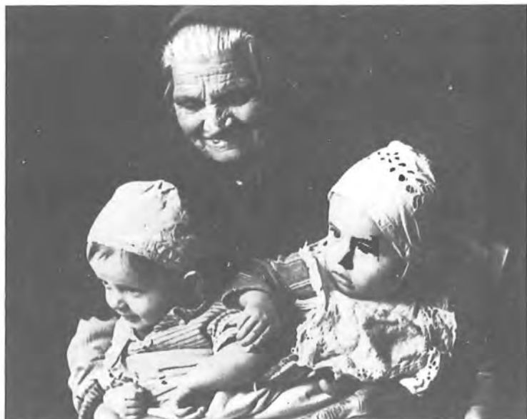
Ἡ γιαγιά μέ τά ἐγγόνια