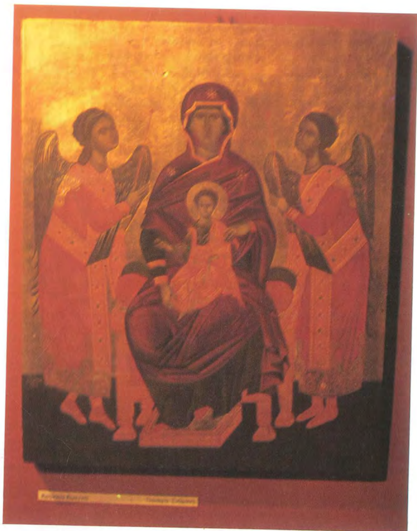
Εικόνα: «Παναγία ένθρονη». Έργο σπουδαστού Αγιογραφίας.