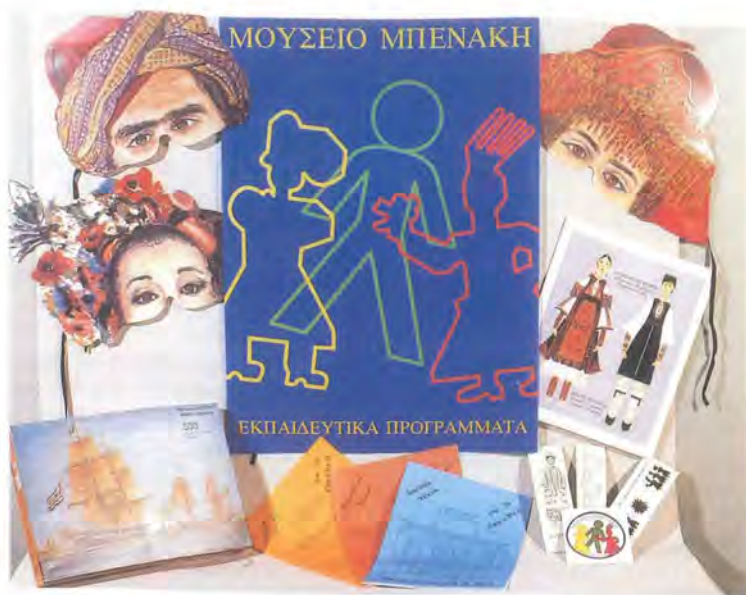
Παιχνίδια και έντυπα των εκπαιδευτικών προγραμμάτων.

μουσείου, οδηγίες για καλύτερη εκμετάλλευση του εκθεσιακού υλικού, καθώς και προτάσεις για μια νέα παιδαγωγική αντιμετώπιση των μουσειακών δεδομένων. Παράλληλα καλούνται οι εκπαιδευτικοί στο μουσείο, όπου ξεναγούνται και γνωρίζουν τους σύγχρονους τρόπους παρουσίασης των εκθεμάτων πριν συνοδεύσουν την ομάδα τους στο μουσείο. Δανειστική βιβλιοθήκη λειτουργεί και για όσους ενδιαφέρονται να ενημερωθούν περισσότερο για κάποιο ειδικό θέμα ή για να δουλέψουν με την ομάδα τους στο σχολείο μετά την επίσκεψη.