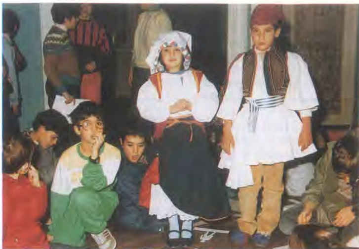
Από την ζωή των εκπαιδευτικών προγραμμάτων για παιδιά.

δεύουν ανα τον κόσμο, ακολουθώντας μια ευρύτερη πολιτική του ιδρύματος για σύσφυξη των δεσμών των λαών μέσω της πολιτιστικής τους κληρονομιάς. Παράλληλα, πλήθος εκδόσεων κάνει γνωστό το υλικό του μουσείου στο ευρύτερο κοινό.