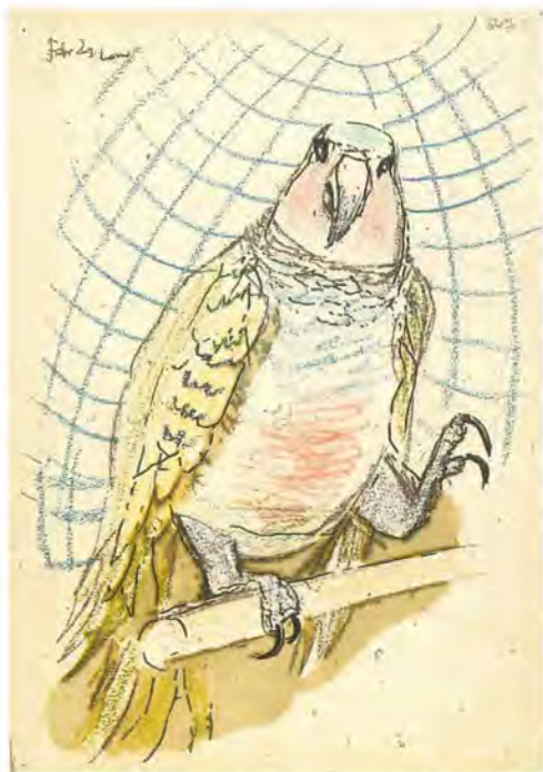
Εικ. 3. Παπαγάλος, σχέδιο με πολύχρωμα κραγιόν και νερομπογιά, 31 x 21,5 εκ. Πινακοθήκη Ν. Χατζηκυριάκου-Γκίκα.

ρακτηριστικό θέμα, μία χαριτωμένη γάτα (εικ. 5), την οποία ζωγράφιζε σιγά-σιγά με ένα τεράστιο μεγεθυντικό φακό, διότι η όρασή του είχε πλέον μειωθεί βασανιστικά.