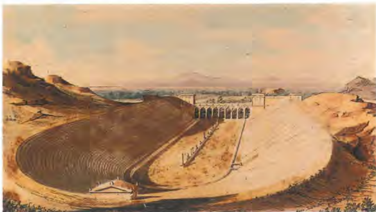
Εικ. 1. Αποψη του Σταδίου. Υδατογραφία Ερνέστου Τσίλλερ.