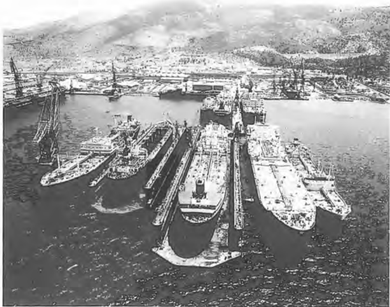
5. Τα ναυπηγεία του Σκαραμαγκά από ελικόπτερο, 4 Ιουνίου 1969.