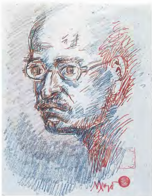
Εικ. 1. Αυτοπροσωπογραφία. Σέπια και κάρβουνο, 27 X 21 εκ. 1955