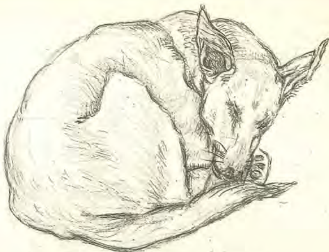
Εικ. 2. Σκύλος, σχέδιο με μολυβοκάρβουνο, 23 x 23 εκ., μπλοκ 95. Πινακοθήκη Ν. Χατζηκυριάκου-Γκίκα.

δεν έσβησε κι όταν ακόμη άφησε την τρυφερή ηλικία και ώριμος νέος πια αφοσιώθηκε στο έργο του. Για παράδειγμα, την αγάπη του για τα άλογα (εικ. 4) μαθαίνουμε από τον πολύ καλό του φίλο Άγγελο Κατακουζηνό με τον οποίο έκανε τακτικά ιππασία κατά τη διάρκεια των φοιτητικών του χρόνων, όταν ζούσε στο Παρίσι (1) .