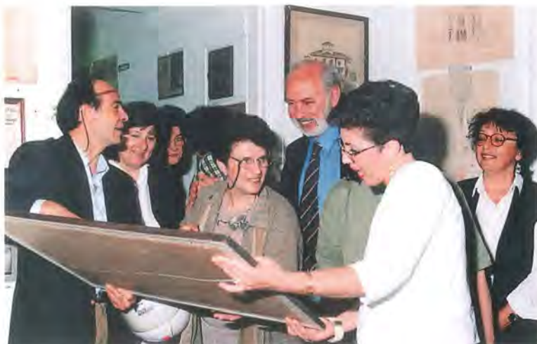
Εικ. 2. Αποψη του Κέντρου από τα εγκαίνια της πρώτης Εκθεσης αρχαιολογικού υλικού, Μάϊος 1996.