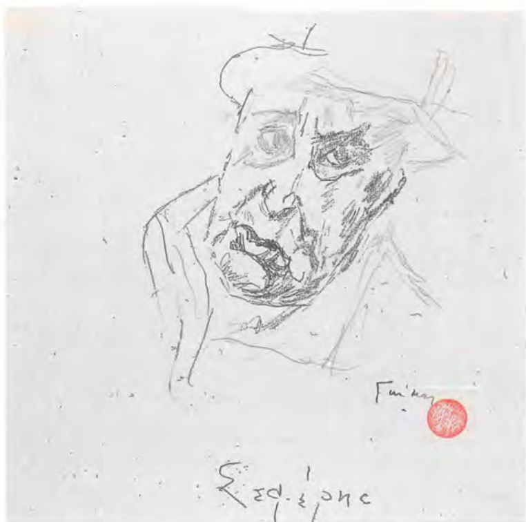
Εικ. 2. Γιώργος Σεφέρης. Μολύβι, 27 X 23 εκ. 1972.

περίπου σχέδια του συγκεκριμένου θεματικού κύκλου που περιλαμβάνονται στη δωρεά του Γκίκα στο Μουσείο Μπενάκη, παρουσιάστηκαν χαρακτηριστικά έργα στα οποία αποτυπώνονται κυρίως πρόσωπα του στενού οικογενειακού και φιλικού περιβάλλοντος του ζωγράφου. Τα πορτραίτα του πατέρα του, ναύαρχου Αλέξανδρου Χατζηκυριάκου (1953), της γιαγιάς του Ελένης Γκίκα (δεκαετία του '20), της Τίγκης, πρώτης γυναίκας του (3 σχέδια των ετών 1935 - 45) και της Barbara, της δεύτερης (10 σχέδια - 1960/65), αλλά και πολλές αυτοπροσωπογραφίες. Επίσης οι προσωπογραφίες προσωπικοτήτων με τις οποίες ο Γκίκας συνδέθηκε στενά και συνεργάστηκε, και ανάμεσα στις οποίες ξεχωρίζουν: