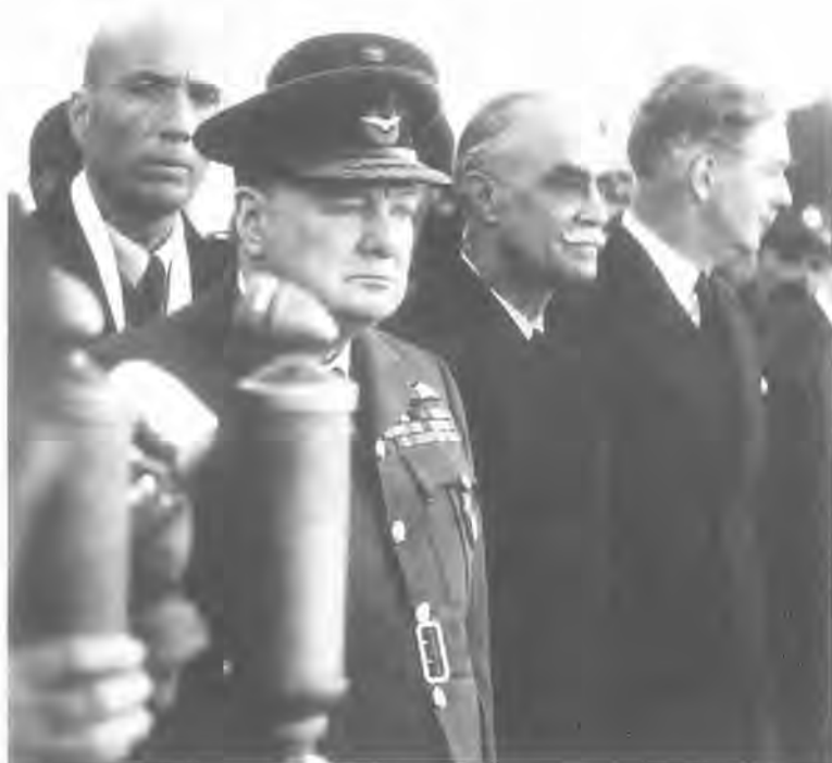
3. Ο πρωθυπουργός της Αγγλίας Winston Churchill, ο έλληνας πρωθυπουργός στρατηγός Νικόλαος Πλαστήρας και ο άγγλος υπουργός Εξωτερικών Sir Antony Eden στην Αθήνα, 14 Φεβρουαρίου 1945.

της καθαρής φωτογραφίας (straight photography) και δηλώνει θαυμαστής του κυρίου εκπροσώπου της, αμερικανού φωτογράφου Edward Weston.