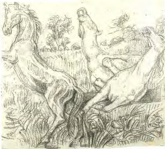
Εικ. 4. Άλογα, σχέδιο με κάρβουνο, 20 x 22,5 εκ., μπλοκ 72. Πινακοθήκη Ν. Χατζηκυριάκου-Γκίκα.

σχέδια αυτά, είναι το υπερτονισμένο, από διάφορους κριτικούς της τέχνης, στοιχείο της ελληνικότητας του έργου του ζωγράφου. Μας δείχνει ξεκάθαρα το πόσο είναι δεμένος με τον τόπο του, με μυστικούς και άρρηκτους δεσμούς, πόσο ο τόπος αυτός τον εμπνέει και πόσο ελεύθερα και πειστικά τον ερμηνεύει βρίσκοντας την βαθύτερη ουσία του.