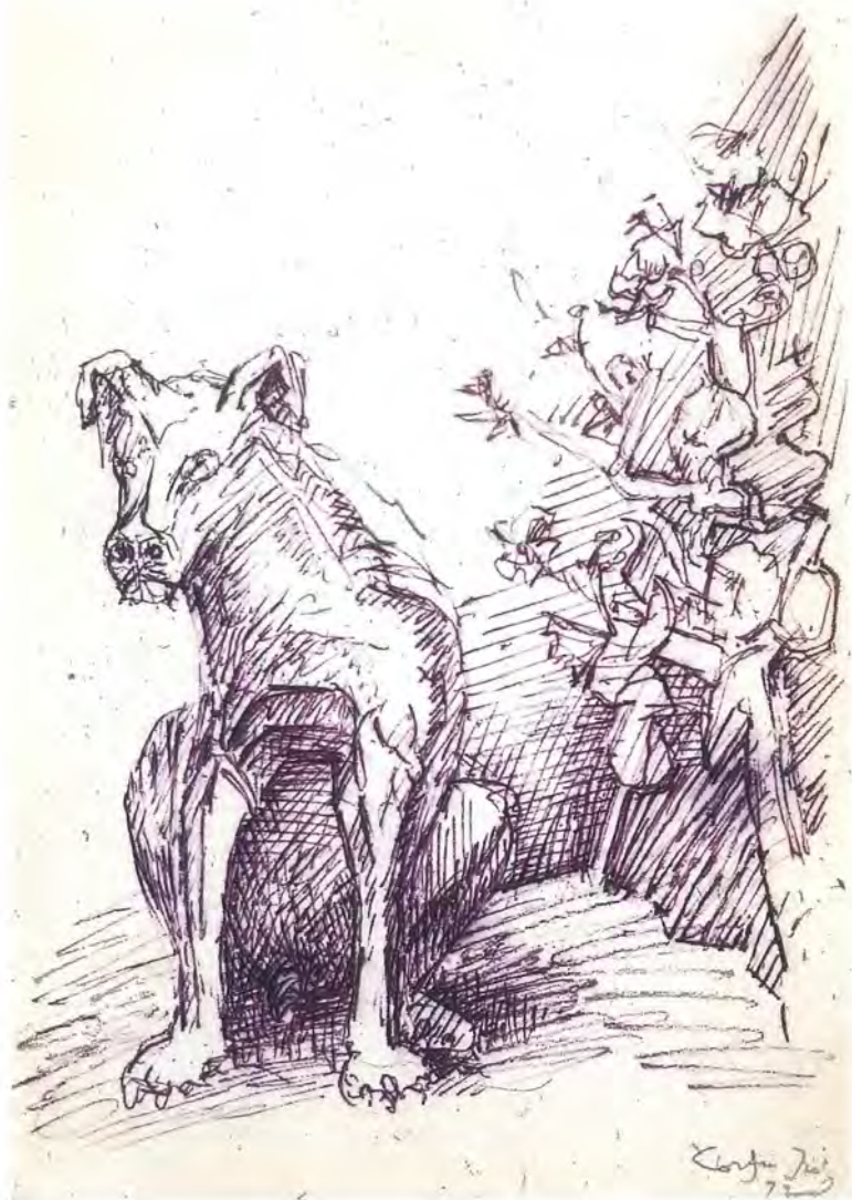
Εικ. 1. Σκύλος, σχέδιο με μελάνι, 17,5 x 11,5 μπλοκ 86. Πινακοθήκη Ν. Χατζηκυριάκου-Γκίκα.