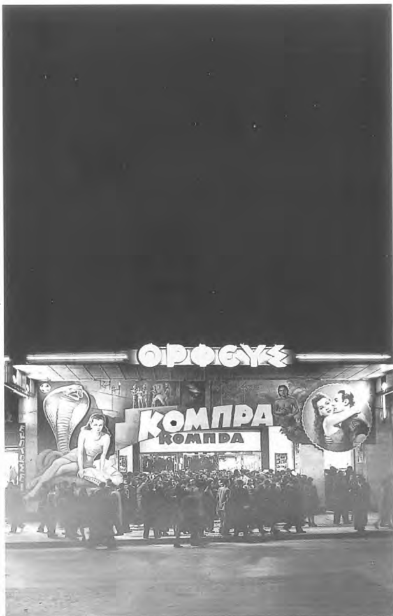
10. Ο αθηναϊκός κινηματογράφος "Ορφεύς", Φεβρουάριος 1947.