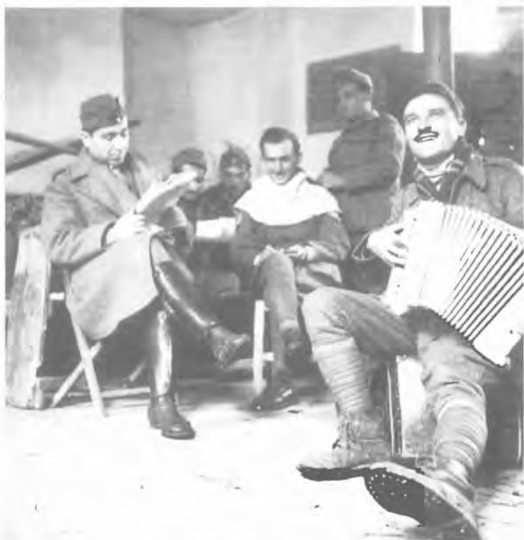
2. Αλβανικό μέτωπο. Στρατιώτες σε ώρα αναψυχής, 1940-1941.

θευτον φωτογραφίαν και πάντα προσπαθώ να επιτύχω το ανώτατον δυνατόν από το φωτογραφικόν μέσον". Σε άλλο σημείο του ίδιου κειμένου αναφέρει σχετικά με τα θέματα που επιλέγει: "Έχω να παρατηρήσω ότι σαν επαγγελματίας και διευθυντής ενός μάλλον μεγάλου φωτογραφικού πρακτορείου δεν έχω μεγάλα περιθώρια επιλογής, ωστόσο κατορθώνω συχνά να αρνηθώ εργασίες που δεν μου αρέσουν. Πέραν όμως του επαγγελματικού τομέως ποτέ δεν έπαψα να φωτογραφίζω για τον εαυτό μου και εδώ είναι που ξαναγίνομαι ερασιτέχνης. Αρχίζοντας από τις φωτογραφίες τοπίων βρήκα το ενδιαφέρον μου να αυξάνεται σιγά-σιγά από τα σχέδια και τις φόρμες που περιείχαν. Τελευταία προσέθεσα στα ενδιαφέροντά μου και το ανθρώπινο ον. Αυτό το ον που αποτελεί το πλέον ενδιαφέρον θέμα που υπάρχει εις τον Κόσμον". Ακόμη σε συνέντευξη του στο περιοδικό Odyssey , Μάρτιος 1959, τάσσεται υπέρ