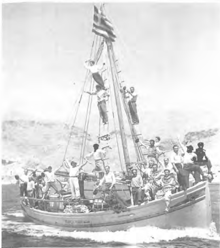
11. Το ξεκίνημα των σφουγγαράδων, Κάλυμνος 1950.

κα φωτογράφους". Ακολούθησε η έκθεση "Δύο Έλληνες Φωτογράφοι Δ. Χαρισιάδης - Α. Κωνσταντινίδης", η οποία ταξίδεψε και σε πολλές άλλες πολιτείες της Αμερικής με ευθύνη του Smithsonian Institution.