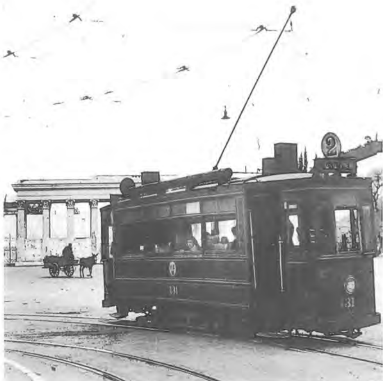
9. Μπροστά στο Παναθηναϊκό Στάδιο, 1949.

Η αναγνώριση ήλθε νωρίς και από το εξωτερικό. Ο Χαρισιάδης συμμετείχε με ένα φωτογραφικό θέμα στην ιστορική έκθεση "Family of Man" που οργάνωσε ο διάσημος φωτογράφος και επιμελητής του φωτογραφικού τμήματος του Μουσείου Μοντέρνας Τέχνης της Νέας Υόρκης, Edward Steichen. Η έκθεση, που μέσα από 503 θέματα, 276 ουμανιστών φωτογράφων, ύμνησε τον άνθρωπο και τις δυνατότητές του, παρουσιάστηκε το 1955 στη Νέα Υόρκη και στη συνέχεια ταξίδεψε σε πολλές χώρες, ανάμεσά τους και στην Ελλάδα το 1958. Την ποιότητα της δουλειάς του διέκρινε και ο Peter Pollack, επιμελητής του Art Institute of Chicago και γνωστός κριτικός φωτογραφίας, με την ευκαιρία ενός ταξιδιού του στην Αθήνα. Με τις φωτογραφίες του καθώς και μερικών άλλων ελλήνων φωτογράφων, ανάμεσά τους και του αρχιτέκτονα Άρη Κωνσταντινίδη, παρουσίασε το 1957 στο Σικάγο την έκθεση "Η Ελλάδα από έντε-