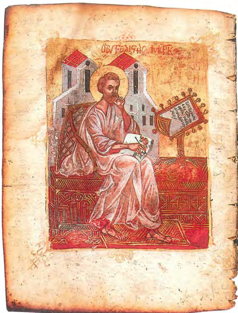
Εικ.: 1. Ο Ευαγγελιστής Μάρκος