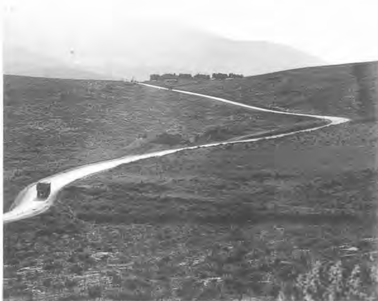
12. Προς Χαλκίδα, 1955.

τοπίου και η αρχιτεκτονική του έμοιαζαν πολύ με της Ελλάδας".