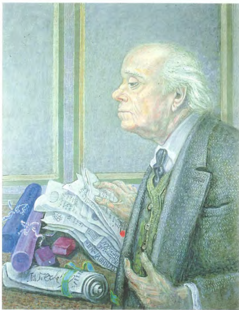
Εικ. 3. Ι. Ν. Θεοδωρακόπουλος. Λάδι σε μουσαμά, 1976.