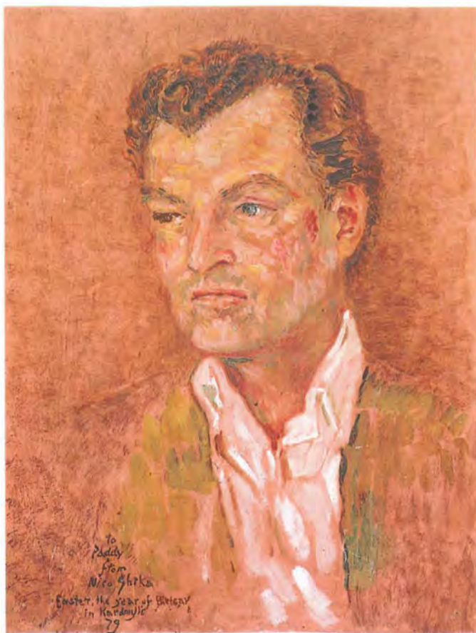
Εικ. 5. Patrick Leigh Fermor. Ακρυλικό σε χαρτόνι, 50 X 35 εκ. 1979.

τασκευές, κυριαρχούν στις ζωγραφικές τους δημιουργίες. Ωστόσο, ήδη από τα πρώτα καλλιτεχνικά του βήματα ο Γκίκας ασχολήθηκε με την προσωπογραφία και έδωσε σημαντικά έργα, όπως οι αυτοπροσωπογραφίες του 1921 (το πρώτο του έργο) και του 1942, τα πορτραίτα του πατέρα του Αλέξανδρου Χατζηκυριάκου, του Τέριαντε, καθώς και αξιόλογα γυναικεία πορτραίτα. Εκτοτε, σποραδικά μόνο εμφανίζονται προσωπογραφίες στα θέματα του, παρόλο ότι η ανθρώπινη μορφή χρησιμοποιείται συχνά σε γυμνά, πολυπρόσωπες συνθέσεις και μυθολογικές σκηνές.