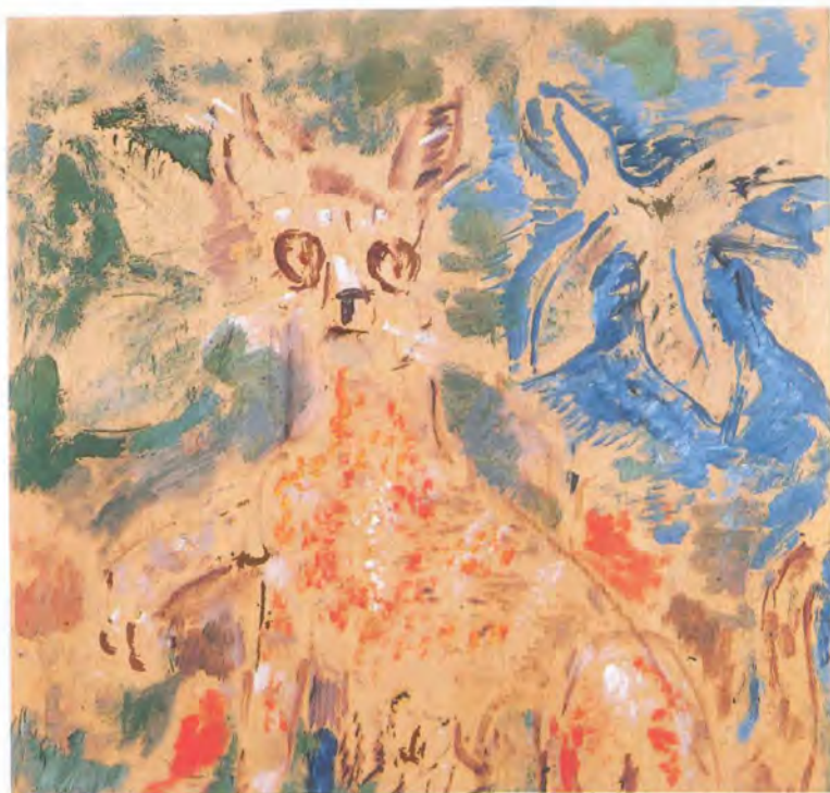
Εικ. 5. Γάτα, ελαιογραφία σε κόντρα πλακέ, 1992, 52 x 36 εκ. Πινακοθήκη Ν. Χατζηκυριάκου-Γκίκα.